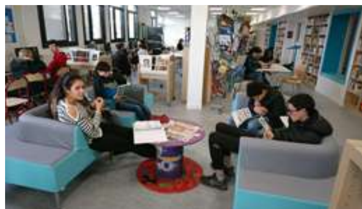
Salles de classe