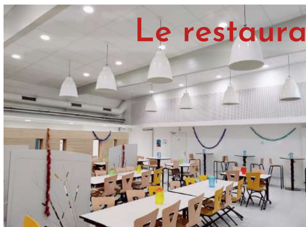
Le restaurant scolaire